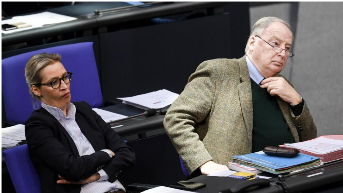
AfD-Politiker Alice Weidel und Alexander Gauland im Bundestag (Archivbild)