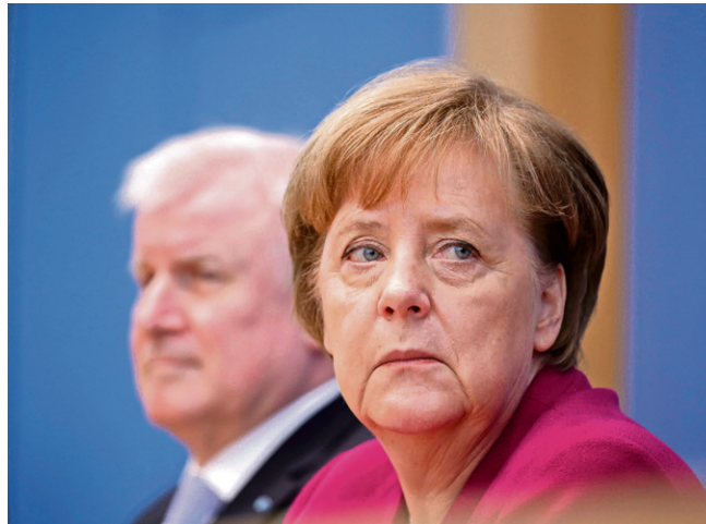
Merkel og Seehofer. »Jeg kan ikke længere arbejde sammen med den kvinde,« skulle Bayern-politikeren have udtalt om kansleren.

Men Merkel er ikke typen, der giver op. Hun har de seneste dage mødet med både Italiens nye premierminister, Giuseppe